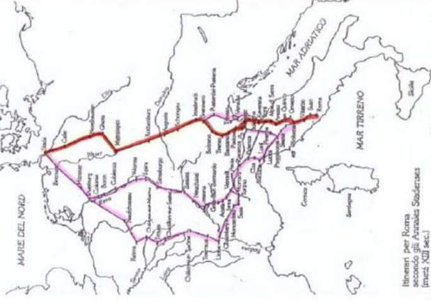
Itinerari per Roma secondo gli Anzalesi Stabiermas (Inizi. XII sec.)